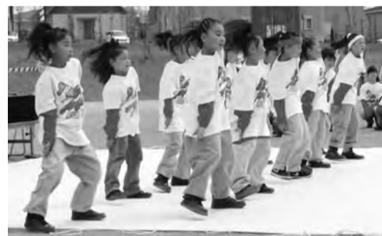
地元のダンスサークルがヒップホップダンスを披露

されます。そこで、こうした状況を取り巻く経営環境や地域経済が抱える課題に対し、有識者と企業そして行政からなる検討委員会を市原商工会議所内に設置し、市産業の方向性、あるべき姿の検討を行ってまいりました。本件については、4月19日行政に対し提言いたしました。