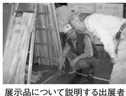
展示品について説明する出展者

支部マップについてのアンケート調査を実施した結果、マップは半数の方が認知しており、展示会については、好感を持った方が8割以上に上った。三和支部では、今後も三和地区内の会員事業所の知名度を上げ、買ひ物や発注を受けることで、